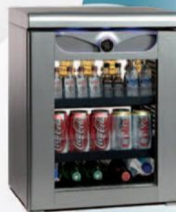
60 літрів (скляні дверцята)