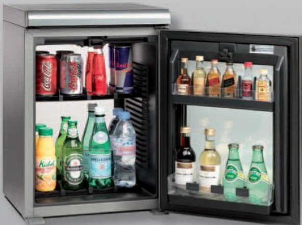
Модель: SC-40i Ємність: до 30 продуктів (включно 1-літрові пляшки)