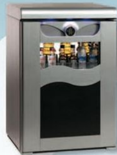
Частково скляні дверцят-хвиля