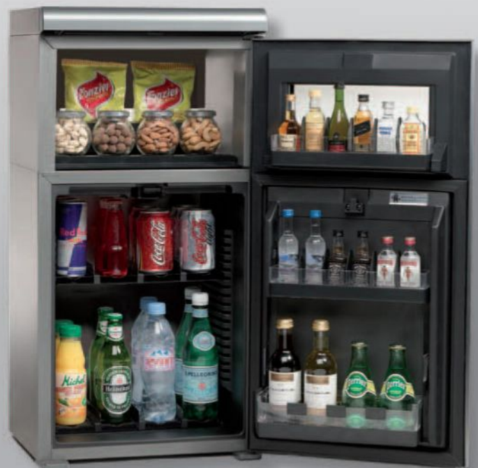
Модель: SC-40s Ємність: до 44 продуктів (включно 1-літрові пляшки)