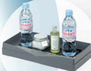
SmartTray (4 сенсори)