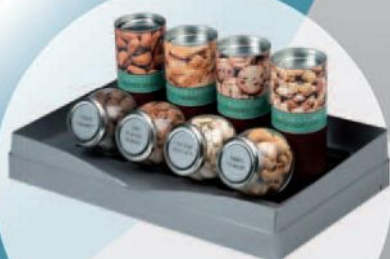
SmartTray (8 сенсори)