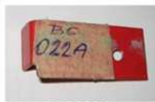
BC 022A template