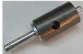
BF40 hole cutter Ø24mm +BF 39 shank with thorn