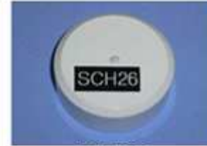
Sch 26 Ø 35,7 mm