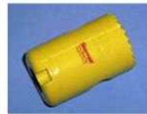
BF 35 + BF 3 Ø 35 mm